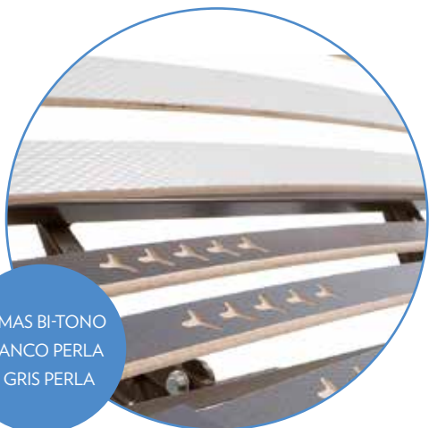
LAMAS BI-TONO BLANCO PERLA Y GRIS PERLA