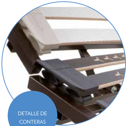
DETALLE DE CONTERAS